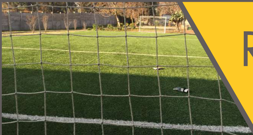
CONDOMINIO PARQUE PALENA